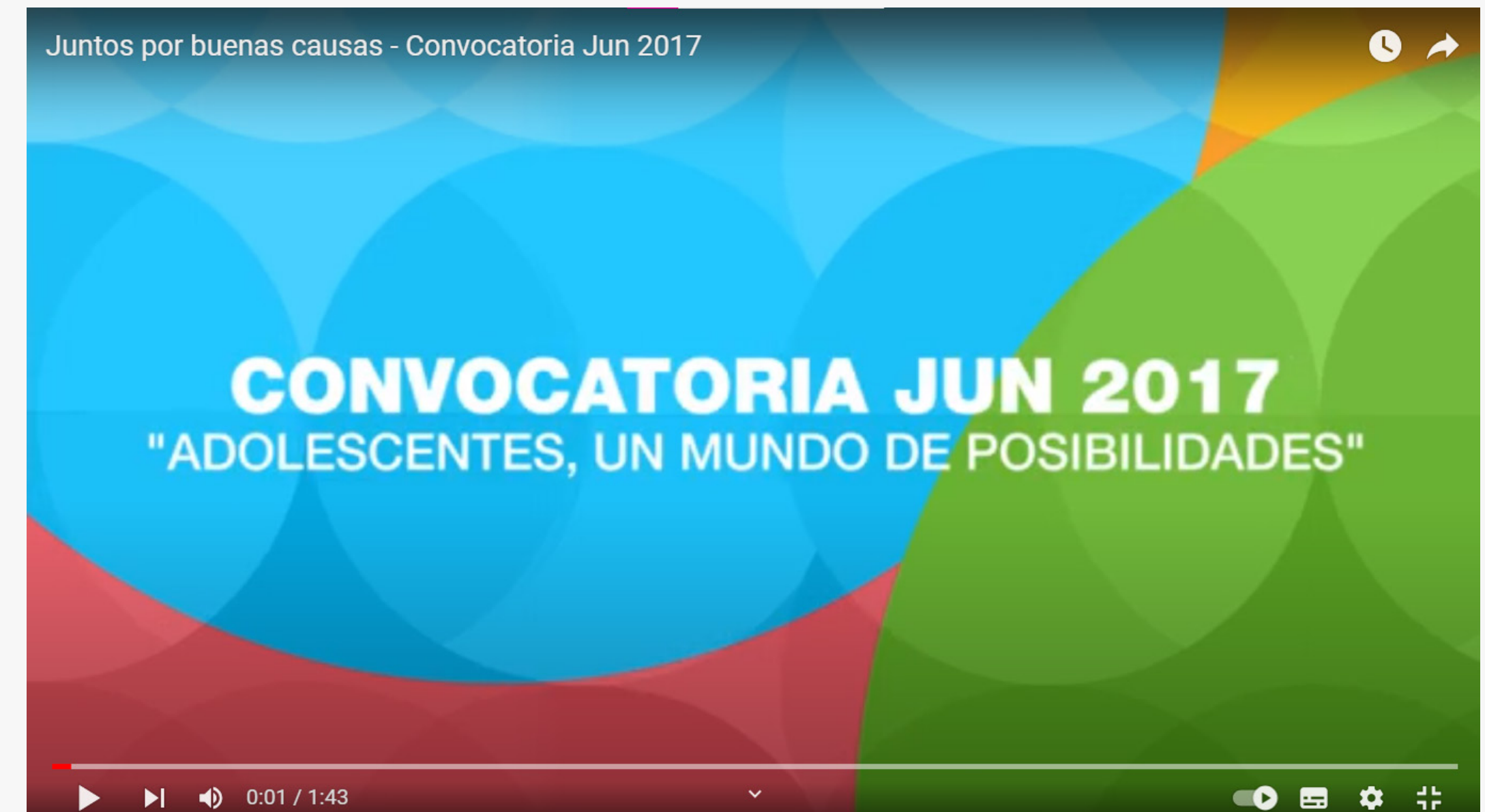
Convocatoria 2017 (Link Video)